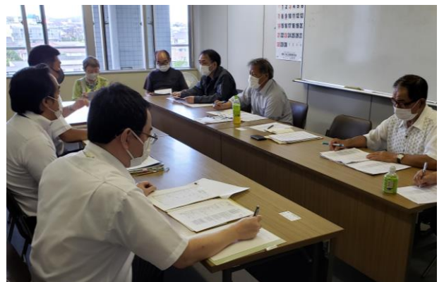
自治体キャラバンの懇談の様子

主に①公務職場で働く労働者の長時間労働の是正、労働安全衛生②会計年度任用職員の労働条件改善③コロナ感染症対策④公契約適正化の課題・公共工事⑤市町村合併後の状況