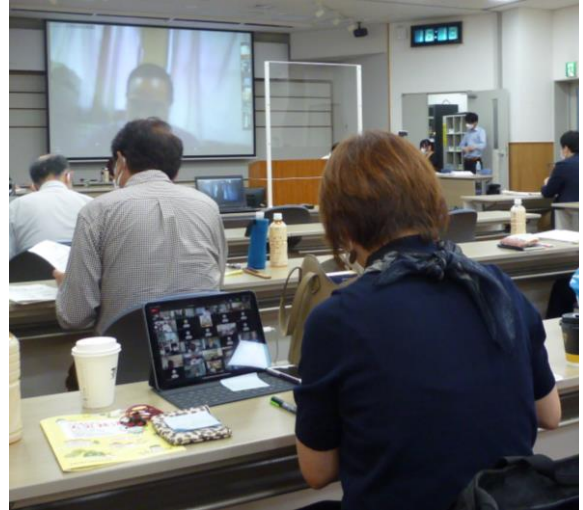
生活向上のため共済活動を考える

2 日目は、各県や単産の取組報告と実務の勧め方の説明がありました。本部と県の担当者が連携を計り、拡大に取り組みます。