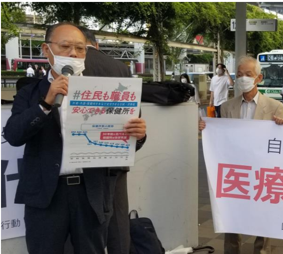
千葉駅前でのちまもる緊急行動実施

いよいよ総選挙がおこなわれます(10月19日公示、10月31日投開票)。野党が求めてきた臨時国会開会に背を向け続けてきた上に、予算委員会での質疑を封殺するもので、政権発足の最初から国会審議から逃げ、「ご祝儀相場」頼みで総選挙を逃げ切ろうというのです。この総選挙は、新自由主義の政治を進めて貧困と格差を拡大し、コロナ対策でも自己責任を押し付けてきた自公政権を終わらせ、労働者の要求実現に向けて野党連合政権を実現する絶好のチャンスです。市民と野党の共闘を全国各地で積み重ねてきた結果として、かつて経験したことがない、政権選択を前面に掲げた歴史的な選挙です。政権交代を実現し、新しい野党連合政権誕生で要求実現につなげるために、政党支持の自由、政治活動の自由をお互いに保障しながら、すべての組合員が投票に